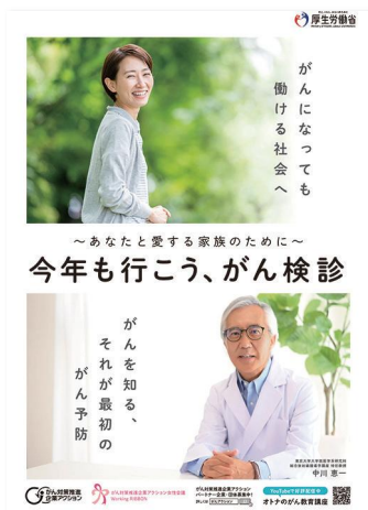
社内掲出用のポスターを無料でプレゼント

無料でも、ここまでできる会社のがん対策！ 「がん対策推進企業アクション」に登録しましょう。