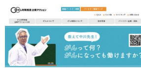
YouTubeでも議長の中川先生が講義