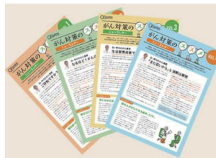
毎月最新の情報をNewsとしてお届け