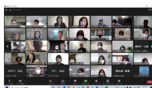
企業同士の情報交換オンライン会議の様子