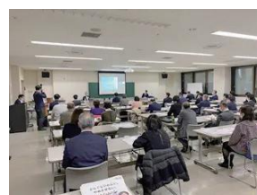
特別講師によるオンライン・オフライン無料研修